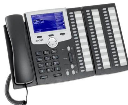
CTS-330 z konsolą CTS-338

Profil telefonu jest tworzony i przechowywany w pamięci centrali Slican dlatego z telefonu można korzystać natychmiast po włączeniu go do sieci, bez skomplikowanego i czasochłonnego programowania. Programowalne przyciski BLF pozwalają na indywidualne kreowanie funkcji, usług, czy też tworzenie listy podręcznych kontaktów. Dla wygody i zwiększenia liczby przycisków szybkiego wyboru, użytkownik może podłączyć do telefonu systemowego serii CTS-330 do 4 konsol Slican CTS-338, zwiększając ilość programowalnych przycisków do 171.