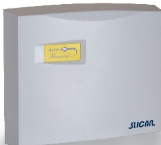
■ BRAMOTEL CBRA1

Bramotel jest nowoczesnym urządzeniem elektronicznym pozwalającym połączyć klasyczną instalację domofonową z linią telefoniczną. Umożliwia łączność z kasetą domofonu lub bramofonu przy pomocy standardowych aparatów telefonicznych. Rozwiązanie to daje szereg nowych możliwości użytkowych w porównaniu do zwykłego bramo- lub domofonu, dlatego też jest doskonałą alternatywą dla instalacji niewielkich centralek telefonicznych. Może je świetnie zastąpić – łącząc funkcje centrali i domofonu – w domkach jednorodzinnych, warsztatach, niewielkich firmach lub biurach.